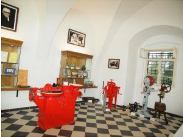
Zámek v roce 2012