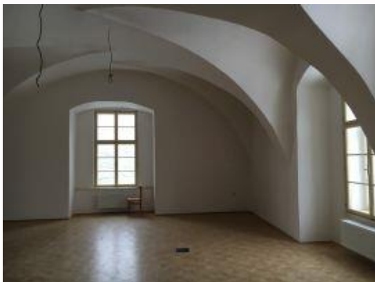
místnost 2.01 v II.NP

Bez této finanční pomoci bychom nemohli s obnovou pokračovat. Upřímné poděkování patří MKČR a Olomouckému kraji, že i pro letošní rok přidělili nemalou částku ze svých dotačních programů na obnovu našeho renesančního zámku v Hustopečích nad Bečvou.